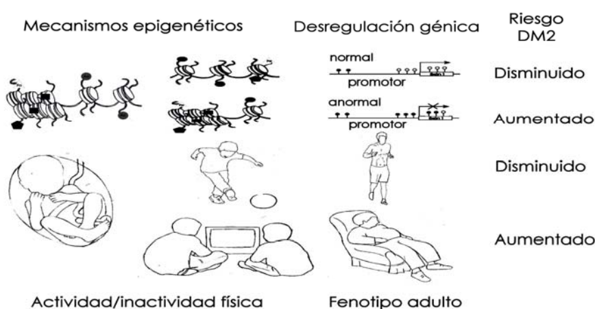
Figura 2. Actividad física en etapas tempranas como modulador del riesgo de DM2 en el individuo adulto.

Durante el periodo postnatal el músculo esquelético está en un proceso de desarrollo activo, debido a la evolución de la conducta motora, la cual podría modelar la respuesta adulta del músculo esquelético, en la medida que en este órgano existan células mitóticamente activas que puedan heredar los patrones epigenéticos adquiridos durante esta etapa, de manera tal que sean estos mecanismos los responsables de generar mayor riesgo de DM2 en los sujetos sedentarios (Figura 2).